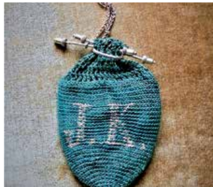
Gestrickter Geldbeutel um 1900, innen Leder, vergoldeter Steckverschluss

Parallel zur Ausstellung im Markgräfler Museum „Am Anfang war das Gold. Geldgeschichte der Region von den Kelten bis heute“ sind in der Mediatheksvitrine alte Geldbeutel, Sparstrümpfe, Sparbüchsen, Spardosen und Sparschweine ausgestellt und illustrieren die Aufbewahrungsmöglichkeiten von Geld und Gespartem in den letzten drei Jahrhunderten. Die Spardosen gibt es in vielfältigen Formen, z.B. in Form eines Hundes - als Wächter des Geldes -, eines Huhns, einer Kirche, einer Litfaßsäule... oder z.B. als Kombination von Sparkasse, Tischuhr, Spieluhr und Kalender. Die Geldbeutel des 19. Jahrhunderts waren häufig gestrickt und mit Perlen verziert. Die Ausstellung kann während der Öffnungszeiten der Mediathek besichtigt werden. Ausstellungsende: 19. August 2022