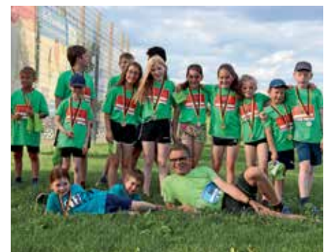
Grosse Freude auch bei den Britzinger Schülerinnen und Schüler einschließlich Coach