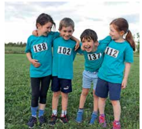
Die Britzinger Bambini freuen sich riesig nach ihrem Rennen

Wir hoffen schon jetzt auf rege Beteiligung!