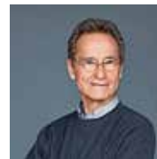
Bernhard Schlink

Büchertisch mit Signiergelegenheit und Einladung zu Wein und Gesprächen nach der Lesung