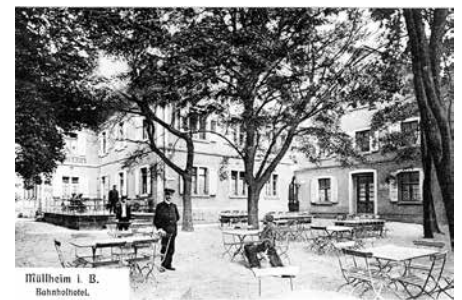
Das Bahnhofshotel in Müllheim, vor 1914